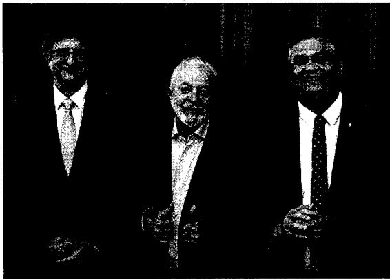
Lula ao lado dos indicados para a PGR, Paulo Gonet, e para o STF, Flávio Dino