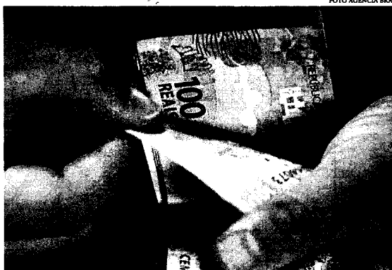
Na contramão da procura, a expectativa é de crescimento da carteira de crédito para 2024

A atividade de Combustíveis e Lubrificantes apresentou resultado negativo de 7,2% nas vendas de novembro de 2023 frente a novembro de 2022, resultado próximo ao auferido no mês anterior (-7,3%), sendo o terceiro resultado negativo consecutivo. Vale lembrar que a trajetória de crescimento da atividade no indicador de volume no segundo semestre de 2022 foi atrelada à políti-