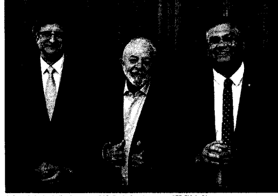
Lula ao lado dos indicados para a PGR, Paulo Gonet, e para o STF, Flávio Dino

Gonet enfrentava resistências no PT por ser visto como