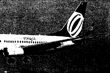
Segundo o GCP, a aprovação permitirá que a empresa pague salários e honre todos os compromissos

Na sexta-feira (26), o juiz da corte Martin Glenn já havia aceitado o pedido da empresa para seguir no processo de proteção contra falência nos Estados Unidos, chamado de chapter 11. Com isso, as partes, sejam pessoas físicas, sócios, corporações, estrangeiras ou nacionais, ficam proibidas de abrir ou dar continuidade a quaisquer ações judiciais ou administrativas contra os devedores, entre outros impedimentos.