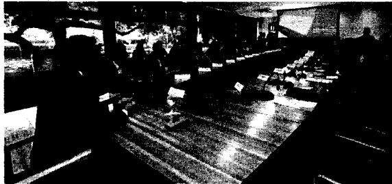
Governador convocou encontro para discutir os efeitos da ocorrência do fenômeno

O governador do Ceará, Elmano de Freitas (PT), realizou reunião nesta terça-feira (28) com vários representantes de secretarias e órgãos do Estado para discutir o cenário atual do El Niño e impacto para 2024, descrito como "preocupante" pelas autoridades presentes ao encontro. Em razão das previsões de chuvas abaixo da média na próxima quadra chuvosa, o Governo estadual, em ação conjunta entre diversos órgãos, irá elaborar plano de ações de contingências para os impactos do fenômeno no próximo ano.