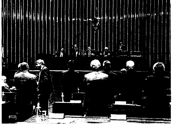
O atual projeto é fruto de pressão dos parlamentares de oposição ao governo

O Senado aprovou na noite dessa terça-feira (20/02) o texto-base do projeto que põe fim à saída temporária de presos, conhecida popularmente como "saidinha", em feriados e datas comemorativas, como Dia das Mães e Natal, por exemplo. A aprovação ocorreu com 62 votos favoráveis e 2 contrários. O texto, no entanto, ainda precisará passar por uma nova votação na Câmara dos Deputados para, depois de aprovado pelos deputados, seguir para sanção presidencial. Além disso, os senadores ainda precisam concluir a análise da matéria votando os destaques, que são as sugestões de mudança que são votadas separadamente. Aliados do presidente Luiz Inácio Lula da Silva (PT) afirmam que ele aguardará a posição dos ministérios sobre o tema antes de decidir se irá derrubar a proposta, caso seja aprovada pela Câmara e encaminhada para sanção do Executivo. Há, no entanto, possibilidade de veto parcial, segundo projeções.