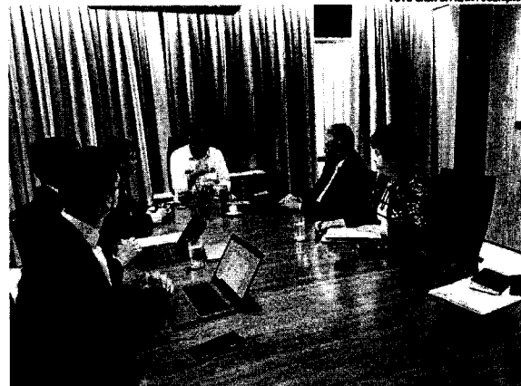
Na próxima semana, o Governo Federal deve discutir medidas a serem tomadas no setor em todo o país

No final de fevereiro, o Jornal O Estado já havia relatado também outros problemas enfrentados por moradores da capital e da Região Metropolitana, que descreve-