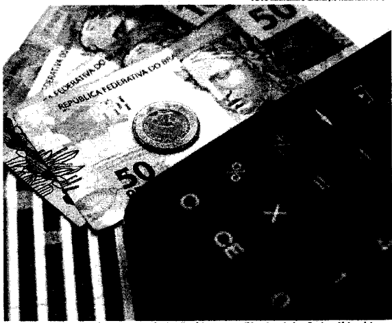
O objetivo da proposição é parar a incidência tributária com a política de valorização do salário mínimo

O Senado aprovou ontem (17) o projeto de lei que corrige a tabela do Imposto de Renda, aumentando a isenção para quem recebe até dois salários mínimos por mês. O texto já foi aprovado pela Câmara dos Deputados e irá à sanção presidencial. O PL 81/2024 reajusta para R$ 2.259,20 o limite de renda mensal que não precisa pagar Imposto de Renda. A lei que instituiu a nova política de valorização do salário mínimo, de 2023, autoriza um desconto sobre o imposto de 25% sobre o valor do limite de isenção, no caso, R$ 564,80, valor que somado a R$ 2.259,20 resulta em R$ 2.824, o que corresponde ao valor de dois salários mínimos. Em seu relatório, o senador Randolfe Rodrigues (Rede-AP) disse que o objetivo da proposição é parer a incidência tributária com a política de valorização do salário mínimo e, assim, evitar sua desidratada. Segundo ele, o Poder Executivo tem apresentado várias propostas para modernizar o Imposto de Renda e torná-lo mais justo. "Certamente várias outras propostas ainda virão. Todas caminhando na direção de, cada vez mais, colocar o rico no Imposto