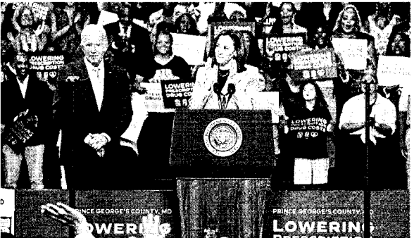
Vice-presidente está quatro pontos percentuais à frente do republicano

Uma nova pesquisa eleitoral divulgada neste domingo (18) pelo The Washington Post-ABC News-Ipsos aponta uma ligeira vantagem de Kamala Harris sobre Donald Trump em intenções de voto para as eleições presidenciais norte-americanas. Vice-presidente está quatro pontos percentuais à frente do republicano. Kamala aparece com 49% das intenções de voto, enquanto Trump tem 45%. A margem de erro é de 2,5%, segundo o The Washington Post-ABC News-Ipsos. Joe Biden e Donald Trump empatados. Pesquisa simulou um cenário de disputa entre o atual presidente e o republicano, em que ambos empatam, com 46% das intenções de voto. Em outra simulação com um terceiro candidato, diferença entre Kamala e Trump é de 3 pontos percentuais. Em um cenário com Robert F. Kennedy Jr., a vice-presidente aparece com 47%, Trump com 44%, e Kennedy Jr. com 5%. Já no início de julho, no mesmo cenário, mas considerando o atual presidente como o candidato democrata da disputa, Trump aparecia com 43%, Biden com 42%, e Kennedy com 9%. Outras pesquisas de intenção de voto indicam que as eleições serão acirradas nos chamados "swing states". Os "estados roxos" são aqueles sem predominância de vitórias republicanas ou democratas ao longo da história e considerados decisivos na escolha da presidência.