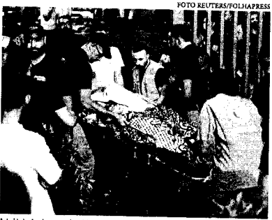
Autoridades locais acusam Israel de orquestrar a ação, que deixou cerca de 200 pessoas em estado grave

Em comunicado, o Hezbollah disse que os equipamentos pertenciam a "trabalhadores em várias unidades e instituições do grupo". Das milhares de pessoas feridas, centenas seriam integrantes da organização. A agência de notícias Mehr, do Irã, divulgou que o embaixador