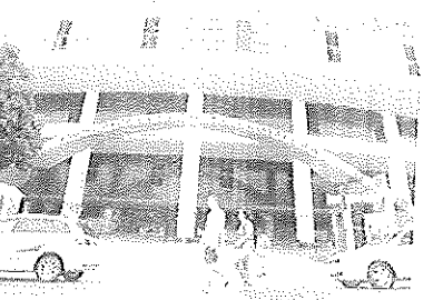
A ideia é reformar toda a estrutura do Mercado Central, dando prioridade aos estacionamentos. A obra ainda está sendo captada por licitação.