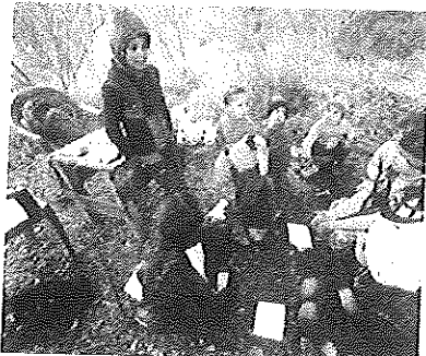
Uma das dificuldades é que meninas e meninos de países afetados por conflitos, como a Síria, representam 50% das crianças fora da escola.

Nova York. O relatório Corrigindo a Promessa Quebrada da Educação para Todos, recém-lançado pelo Fundo das Nações Unidas para a Infância (Unicef), mostra que 121 milhões de crianças e adolescentes no mundo não frequentam a escola. O estudo é da Iniciativa Global sobre Crianças Fora da Escola, um projeto lançado em 2010 pelo Unicef e pelo Instituto de Estatística da Unesco, para ajudar os participantes no desenvolvimento de estratégias baseadas em dados que possibilitem a diminuição do número de crianças e adolescentes sem estudo.