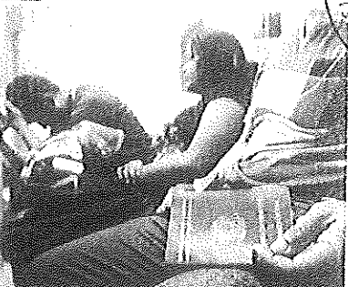
Os primeiros sinais de defloração do mercado de trabalho do Brasil começaram a aparecer em 2014.