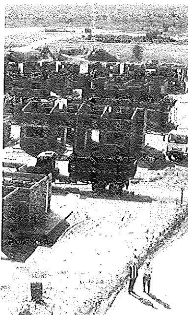
Infraestrutura, habitação, saneamento e capital de giro de pequenas e médias empresas foram citados como prioridades na conversa de Barbosa

A declaração vem em linha com informações publicadas também pela agência de notícias Reuters, que entrevistou uma autoridade do governo na quarta-feira passada (6).