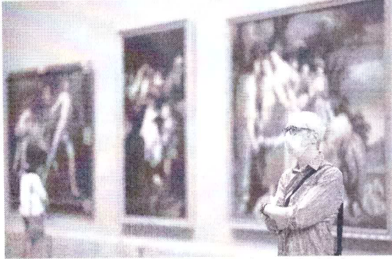
Museus europeus, que atraem milhões todos os anos, estão passando por profundas adaptações

Instituições como a Tate e a National Gallery, em Londres, disseram ser cedo até para falar em planos de reabertura. Mas o Centro Pompidou, maior museu de arte moderna da Europa, já tem data marcada. No 1º de julho, segundo o diretor Bernard Blisène, que planeja inventar "um novo relacionamento com o público", agora que só