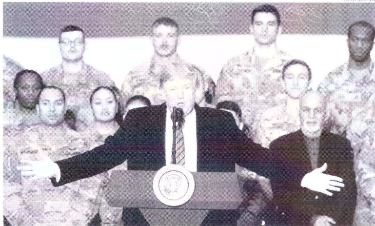
Governo do presidente Trump não aceita que o tribunal julgue denúncias de crimes contra a humanidade

Presidente autorizou sanções contra o Tribunal Penal Internacional por conta de investigações cujos alvos são soldados americanos