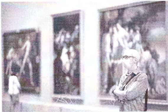
Museus europeus, que atraem milhões todos os anos, estão passando por profundas adaptações

Mas o Centro Pompidou, maior museu de arte moderna da Europa, já tem data marcada - 1º de julho, segundo o diretor Bernard Blistène, que planeja inventar "um novo relacionamento com o público", agora que só