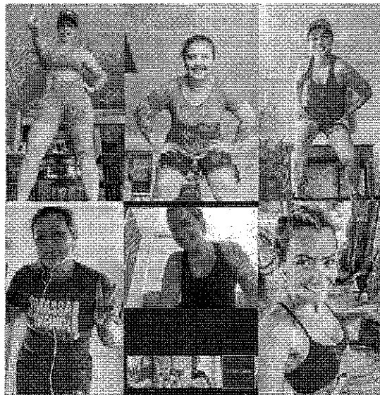
Grupo se reúne diariamente para a prática orientada de exercícios. Aulas são por vídeo