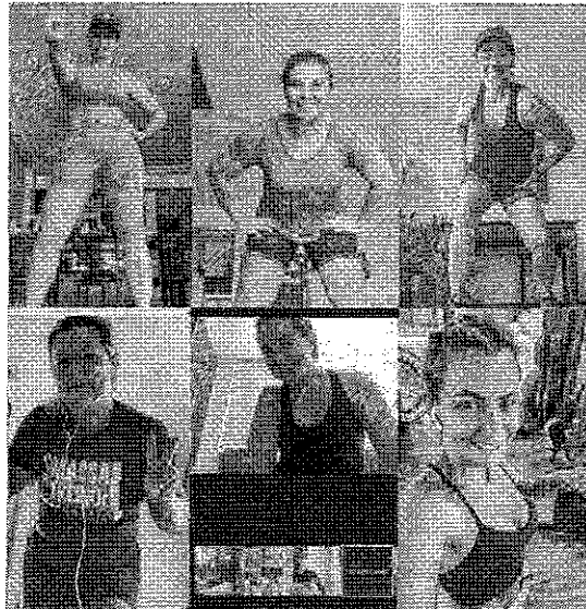
Grupo se reúne diariamente para a prática orientada de exercícios. Aulas são por vídeo