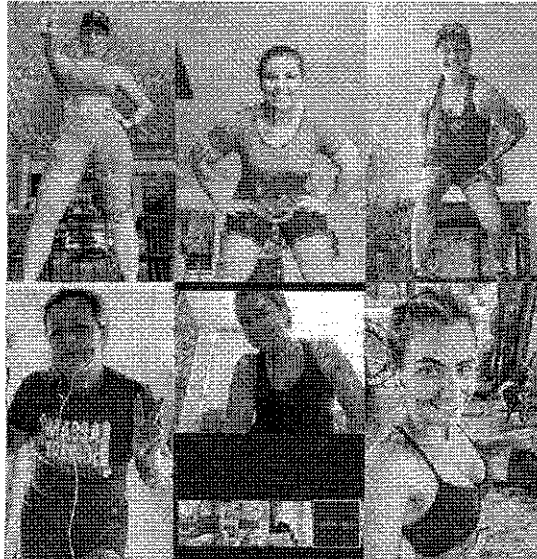
Grupo se reúne diariamente para a prática orientada de exercícios. Aulas são por vídeo