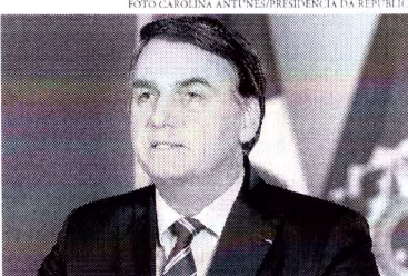
O presidente da República se destacou em outros líderes internacionais por ter minimizado os impactos da pandemia

Presidente voltou a defender ações do Governo Federal tomadas durante a pandemia e reiterou críticas às medidas de distanciamento social