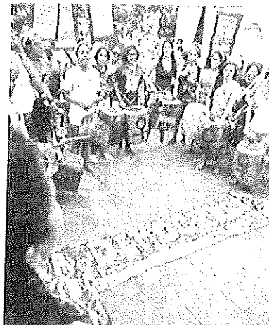
O Centro de Fortaleza, assim como o Palácio da Abolição, recebeu uma série de manifestações em favor do Dia da Mulher.

Além disso, os manifestantes também exigiram a criação de uma comissão para investigar a violência contra as mulheres. O encontro contou com a presença de representantes de movimentos sociais, sindicatos e organizações da sociedade civil. O encontro resultou em um compromisso de maior atenção e recursos para a saúde, educação e moradia no Estado.