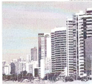
Nos hotéis, o conceito de hospitalidade mudou e, agora, empresas se preocupam mais em oferecer segurança sanitária