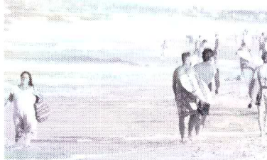
Atividades turísticas no Estado ganharam impulso após os dois feriados e animam o setor no início da retomada

Sul (20%), Santa Catarina (16,3%), Espírito Santo (15,9%), São Paulo (15,8%), Rio de Janeiro (15%) e Pernambuco (12,7%). "Estamos no início da retomada e esse número mostra nossa capacidade e força no setor de turismo. Vamos continuar trabalhando para voltarmos ao patamar que a gente estava antes da pande-