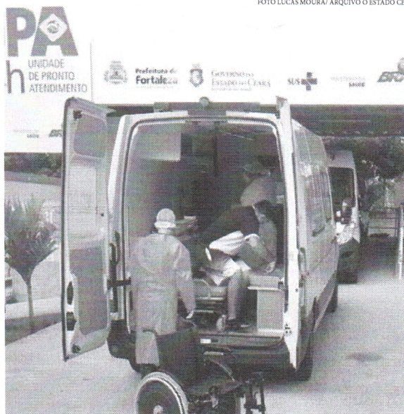
Serviço de Atendimento Móvel de Urgência (Samu) foi essencial para a transferência dos enfermos

município. Na manhã desse domingo (14), gestores da Secretaria da Saúde do Ceará (Sesa) e da Associação dos Municípios do Estado do Ceará (Aprece) estiveram reunidos para tratar das questões referentes ao suprimento de oxigênio hospitalar nas unidades de saúde municipais, que estão com baixos estoques.