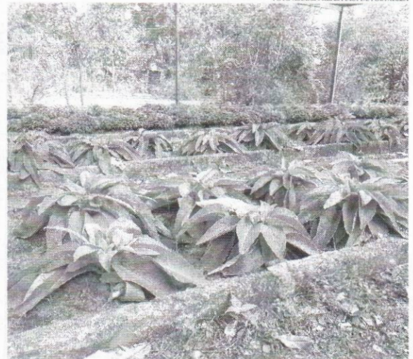
Açafrão e gengibre são duas das 30 espécies encontradas no Horto Estadual da Sesa