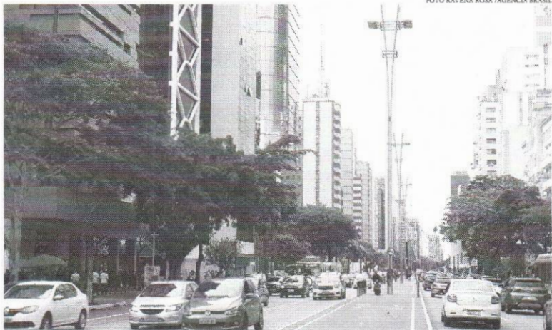
A expectativa do setor é alcançar um aumento de 10% da área de valor geral de vendas em comparação ao ano passado

Os dados divulgados mostram que o desempenho da questão no nosso estado ficou acima da média do Brasil, tendo vendas expressivas no ano