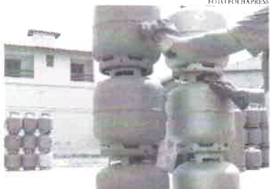
Segundo a Petrobras, medida se justifica pelos efeitos da situação excepcional e de emergência decorrentes da pandemia da covid-19

O presidente Jair Bolsonaro sancionou nessa segunda-feira (22/11) a lei que cria o auxílio gás. O benefício é destinado a famílias inscritas no Cadastro Único para Programas Sociais (CadÚnico), cuja renda familiar mensal per capita seja menor ou igual a meio salário-mínimo nacional, atualmente no valor de R$ 1.100. Também terá direito ao benefício as famílias que recebem o Benefício de Prestação Continuada (BPC). A legislação terá vigência de cinco anos, e o governo não abrirá inscrição para essa modalidade de auxílio. O benefício será pago, preferencialmente, às famílias com mulheres vítimas de violência doméstica que estejam sob o monitoramento de medidas protetivas de urgência. As famílias beneficiadas pelo auxílio-gás terão direito a uma parcela de, no mínimo, 50% da média do preço nacional de referência do botijão de 13 kg de GLP, estabelecido pelo Sistema de Levantamento de Preços da Agência Nacional do Petróleo, Gás Natural e Biocombustíveis (ANP), nos seis meses anteriores.