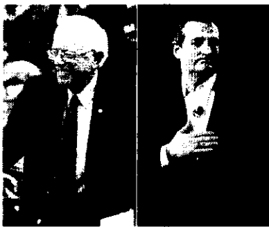
Democrata Bernie Sanders (à esquerda) ganhou em Kansas e Nebraska, enquanto o republicano Ted Cruz (à direita) venceu Trump em Kansas e Maine.

"Já tive muitas competições toda a minha vida", disse Trump, ao comemorar a vitória nos estados de Kentucky e Louisiana. "Não há nada real emocionalmente como esta", acrescentou. Ted Cruz ganhou nos estados de Kansas e Maine, contrariando pesquisas que davam vitória para Trump. "O que estamos vendo em Kansas (e em Maine) é uma mudança de uma verdadeira mudança no impulso", disse