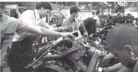
Entre os segmentos que mais contrataram em fevereiro estão os serviços (215,4 mil) e a indústria (43 mil)

No mês anterior, o resultado já havia sido 38% menor do que um ano antes (2021). Para o ministério, a desaceleração é natural após um 2021 de melhora na economia, o fim de medidas emergenciais e a normalização dos dados. Bruno Dalcolmo, secretário-executivo do Ministério do Trabalho e Previdência, disse que os dados neste ano tendem a seguir o desempenho da atividade. "As empresas não vão continuar contratando naquele ritmo do ano passado para sempre, aí [passar a ser] uma questão de crescimento natural da economia", destacou ao cha-