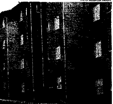
A nova versão do programa, lançado em fevereiro, aumentou o limite de renda para a família poder acessar o financiamento

O subsídio, por sua vez, passou de R$ 47,5 mil para R$ 55 mil. Outra medida foi a redução de juros para famílias da Faixa 1, que passou de 4,25% ao ano para as regiões