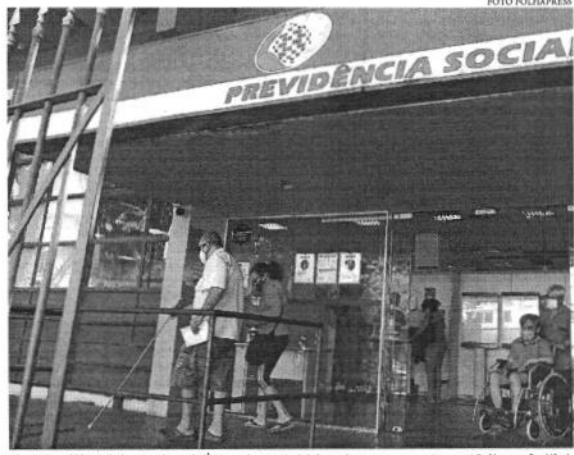
Tem direito ao BPC trabalhadores inscritos no CadÚnico que fazem parte de baixa renda mesmo sem nunca terem contribuído com a Previdência

Desde março de 2022, beneficiários do BPC estavam autorizados a comprometer até 40% do benefício com o empréstimo consignado, que tem desconto direto na folha de pagamento. As mudanças fazem parte do Programa Renda e Oportunidade, pacote de medidas econômicas