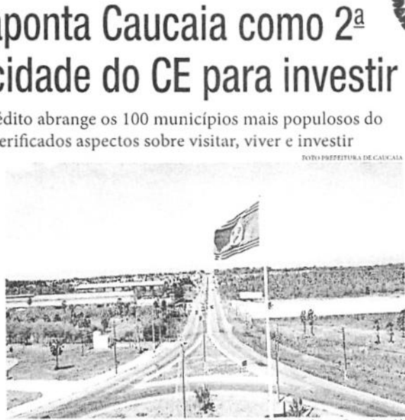
O ranking destaca boas práticas de promoção, visibilidade, procura proativa e oferta de plataformas online e redes sociais

Turismo. Uma nova medida para estimular o turismo na Praia do Futuro será anunciada, nesta sexta-feira (13), pela Prefeitura de Fortaleza. O evento ocorrerá às 16h, na barraca Orbita Blue, com assinatura do decreto que trata de "área de potencial desenvolvimento sustentável da atividade turística".