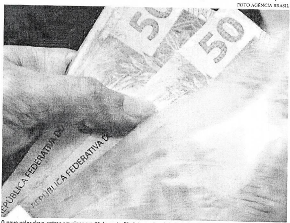
O novo valor deve entrar em vigor em 1º de maio, Dia Internacional do Trabalho. Atualmente, o mínimo é de R$ 1.302

O presidente disse ainda que o mínimo terá, além da reposição inflacionária, o crescimento do PIB. "Porque é a forma mais justa de você distribuir o crescimento da economia. Não adianta o PIB crescer 14% e você não distribuir. É importante que ele cresça 5%, 6%, 7% e você distribui-lo para a sociedade. Nós vamos aumentar o salário mínimo todo ano de acordo com a inflação, será reposta, e o crescimento do PIB será colocado