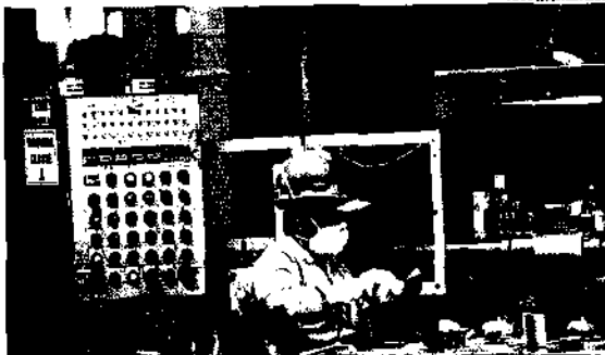
Já o setor de serviços, o principal do PIB do país, teve avanço de 0,6% no primeiro trimestre

O resultado do primeiro trimestre de 2023 foi influenciado pelas condições favoráveis de produção na