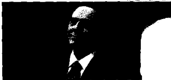
Silvio Berlusconi foi o líder a comandar a Itália por mais tempo desde Benito Mussolini

Nesta segunda-feira, 12, a assessora de imprensa do ex-primeiro-ministro da Itália, Silvio Berlusconi, confirmou que ele faleceu em um hospital na cidade de Milão, aos 86 anos. O bilionário tinha um histórico de problemas de saúde e já havia sido internado para tratar dificuldades respiratórias. Recentemente, Berlusconi, que foi eleito como primeiro-ministro da Itália por três vezes, foi diagnosticado com leucemia. Na última sexta-feira, 09, o político compareceu à unidade de saúde para realização de um check-up. É importante lembrar que este foi o líder a estar à frente do governo italiano por mais tempo, nove anos, atrás apenas do ditador Benito Mussolini.