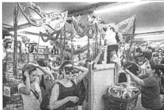
Carnaval de 2023 deve gerar novos postos de trabalho em diversos segmentos do mercado, principalmente o turismo

O aumento dos valores das passagens aéreas tem