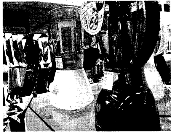
A proposta de um programa de incentivo surge como uma oportunidade para estimular o consumo

Nesse sentido, Lula propôs a Alckmin a adoção de medidas que possam reduzir os custos desses eletrodomésticos, tornando-os mais acessíveis para os consumidores. A ideia é buscar maneiras de baratear a produção e a venda desses produtos, facilitando assim a aquisição por parte da população. Essa sugestão vem após o sucesso do programa de incentivo à compra de carros populares, que foi encerrado na semana passada. Sob esse programa, foram vendidos cerca de 125 mil veículos, considerando tanto compras de pessoas físicas quanto jurídicas. Os descontos oferecidos chegaram a 21%, graças ao apoio do governo e das