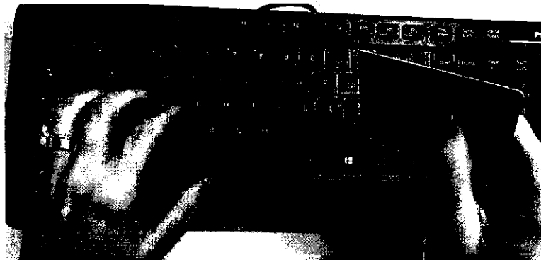
Os efeitos do aperto monetário são sentidos no encarecimento do crédito e na desaceleração da economia

Ceará Já o Ceará registra, pelo quarto mês consecutivo, saldo positivo de novos postos de trabalho, com a criação de 3.435 novos empregos, sendo o segundo maior resultado do Nordeste - atrás somente da Bahia (9.428). O desempenho do Estado foi proveniente da relação entre o número de contratações com carteira assinada (46.216), que superou o de demissões (42.781). Quanto ao salário médio de admissão, o Ceará se destaca como o maior do Nordeste, com o salário de R$ 1.805,06, diz o Caged.