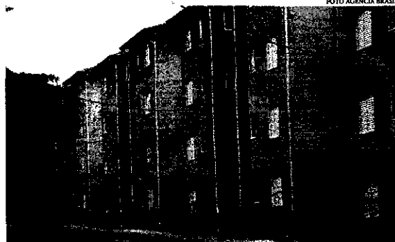
A nova versão do programa, lançado em fevereiro, aumentou o limite de renda para a família poder acessar o financiamento

O subsídio, por sua vez, passou de R$ 47,5 mil para R$ 55 mil. Outra medida foi a redução de juros para famílias do Faixa 1, que passou de 4,25% ao ano para as regiões