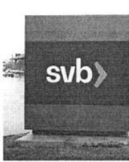
Nesta segunda-feira (13), houve queda nas taxas de juros negociadas nos mercados americano e brasileiro.

ex-diretor do BC e presidente do Conselho de Administração da Jive Investments, afirma que os desdobramentos da crise do SVB podem levar a um corte da taxa básica mais cedo que o projetado anteriormente.