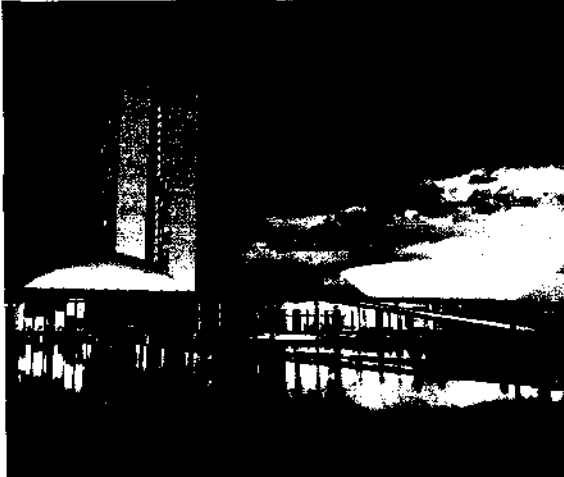
Trata-se de uma CPI mista, o que significa que haverá representação da Câmara e do Senado