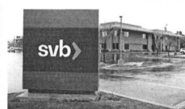
Nesta segunda-feira (13), houve queda nas taxas de juros negociadas nos mercados americano e brasileiro.