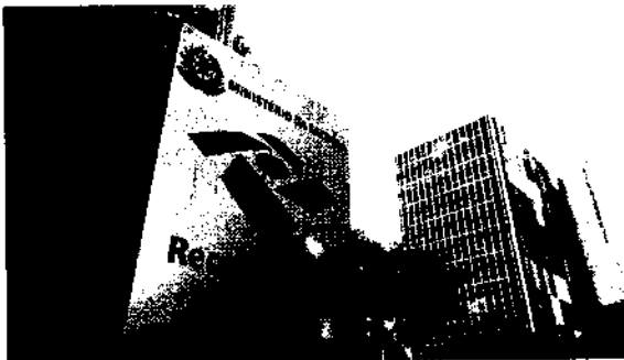
No acumulado do ano, a arrecadação chegou a R$ 581,79 bilhões, representando acréscimo acima da inflação de 0,72%

As desonerações concedidas no Imposto sobre Produtos Industrializados (IPI) e Programa de Integração Social/Contribuição para Financiamento da Seguridade Social (PIS/Cofins) também influenciaram no resultado. Outra importante fonte de arrecadação de março foi a receita previdenciária (R$ 47,06 bilhões), aumento de 6,03%, em razão do aumento real de 11,62% da massa salarial. Também ocorreu crescimento de 41% das compensações tributárias com débitos