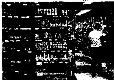
O resultado da inflação no Nordeste está associado em parte ao aumento dos produtos alimentícios

O resultado nordestino está associado em parte ao aumento dos produtos alimentícios, que responde por uma fatia maior do orçamento das famílias mais pobres. No que diz respeito à alimentação, a inflação acumu-