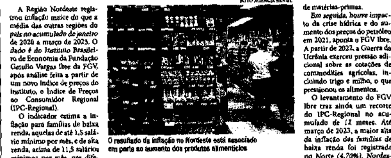
O resultado da inflação no Nordeste está associado em parte ao aumento dos produtos alimentícios

Na Região, a inflação acumulada pela alimentação para baixa renda foi de 43,24% no intervalo dos últimos três anos