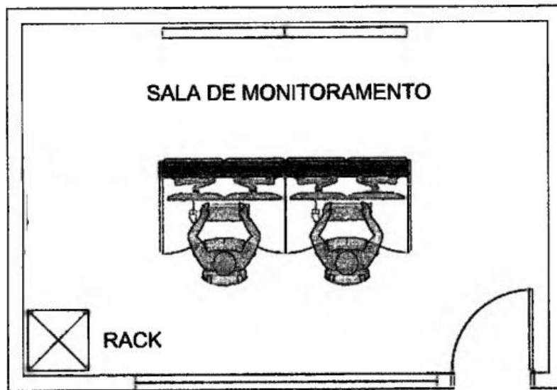
Figura 01– Layout Sala de Operação e Monitoramento

6.6. Serviço de assistência técnica aos equipamentos instalados: