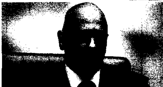
Alexandre de Moraes é cobrado pelos deputados distritais, que questionam sua postura

No último dia 19, Moraes negou o pedido de soltura feito pela defesa - apesar dos argumentos de que os policiais militares supostamente envolvidos já foram ouvidos e que o coronel não oferece nenhum risco para as investigações. O ministro afirmou que as condutas do oficial "sob análise são gravíssimas", e que ainda é