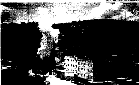
As Nações Unidas e o Egito se manifestaram condenando a escalada de violência na Cisjordânia

A ministra palestina da Saúde, Mal al-Kaila, chegou a pedir o envio "urgente" de material médico, remédios e bolsas de sangue para Jenin.