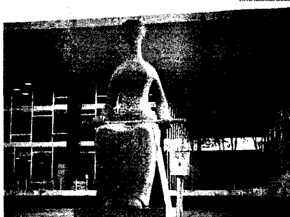
A divergência havia sido aberta pelo ministro Edson Fachin, mas a ministra Rosa Weber acompanhou

A divergência havia sido aberta pelo ministro Edson Fachin, mas a ministra Rosa Weber também julgou