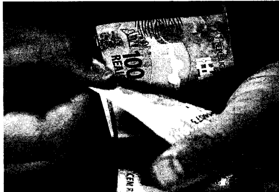
Na contramão da procura, a expectativa é de crescimento da carteira de crédito para 2024

Na avaliação do economista e planejador financeiro, Eldair Melo, a procura do crédito caiu devido à alta taxa de juros da economia brasileira.